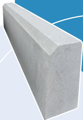
CORDOLO H20 8/10