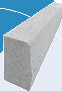
CORDOLO H25 1012