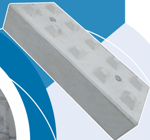
MUROBLOCK BASE 60CM