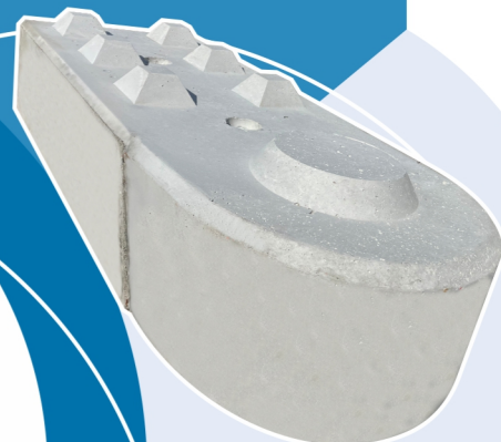
MUROBLOCK TONDO BASE 60CM